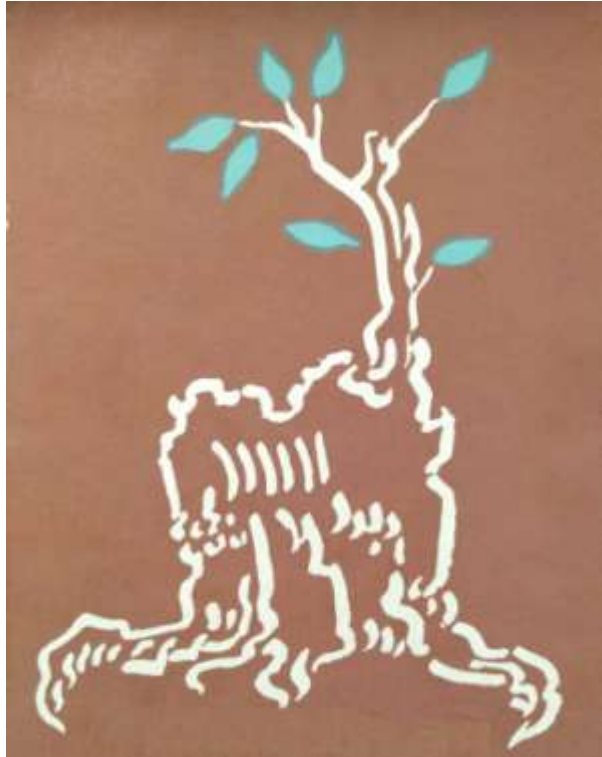
VISION PROFETICA ACERCA DE ISRAEL El fondo del gráfico es del color del suelo de Israel El tronco añejo representa la historia de Israel El rebrote es el moderno Estado de Israel

El fenómeno del Código Bíblico o el Código Secreto de la Biblia Hebrea establece hechos que ninguna persona con dos dedos de frente puede ignorar, cuestionar o refutar. Al menos, entre todos los ateos confrontados con los hechos de la Qábalah Computarizada ninguno he encontrado que crea que los códigos fueron introducidos en el texto invisible de la Biblia por mi tocayo Moisés, sea su texto histórico, poético, ficticio o inclusive errado desde el punto de vista gráfico, ortográfico o gramatical.