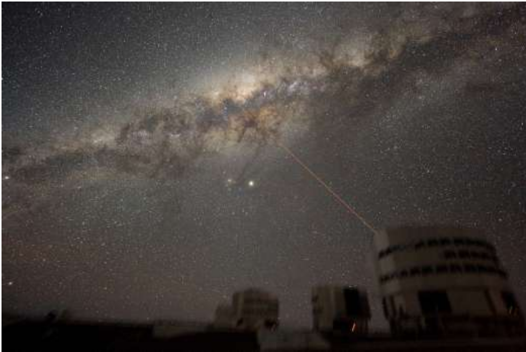
La Vía Láctea, la galaxia donde se encuentra el Sistema Planetario Solar

Quizás donde más se ve la interacción de Teología y Ciencia, sobre todo la ciencia astrofísica, es en el tratado de la Cosmología, que trata del origen y naturaleza del Universo, lo que el Universo es.