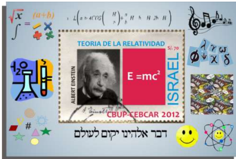
LA ESTAMPILLA DE EINSTEIN