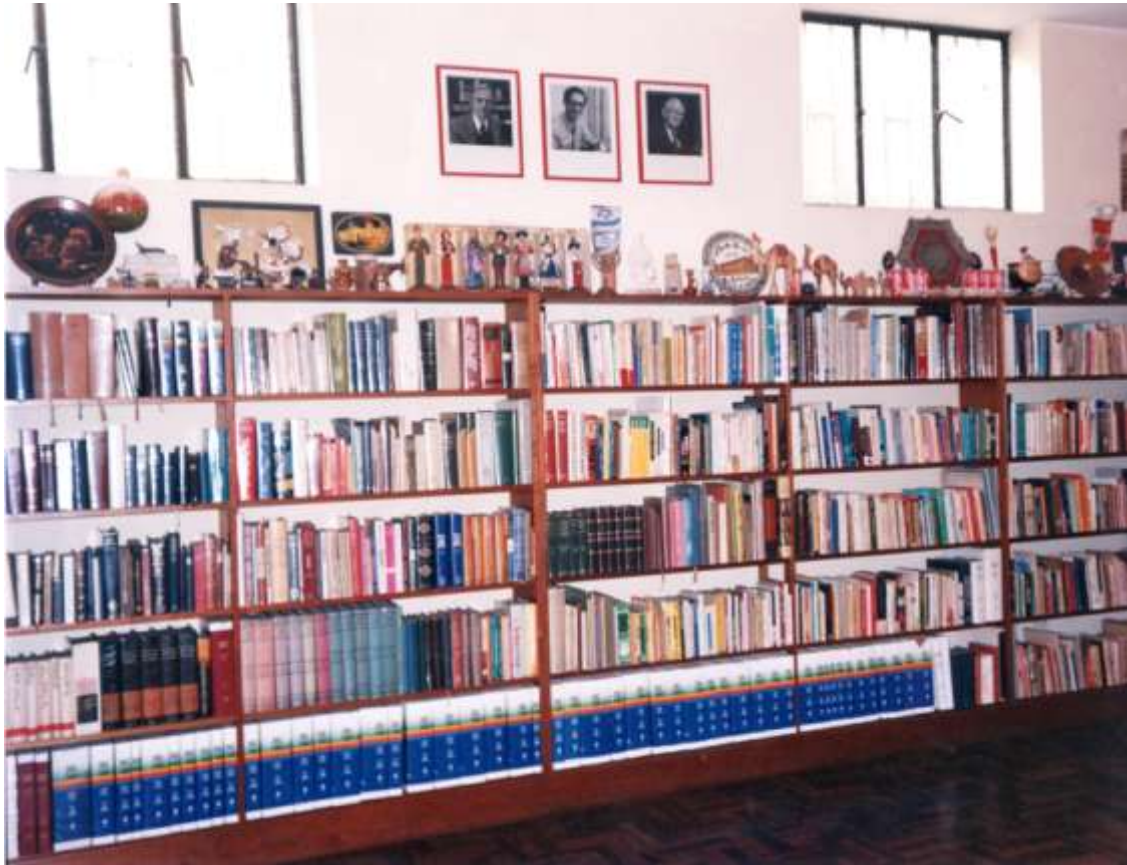
VISTA PARCIAL DE LA BIBLIOTECA INTELIGENTE Y MUSEO DE LA BIBLIA (Al pie, empastados en color azul están los originales de la Biblia RVA)