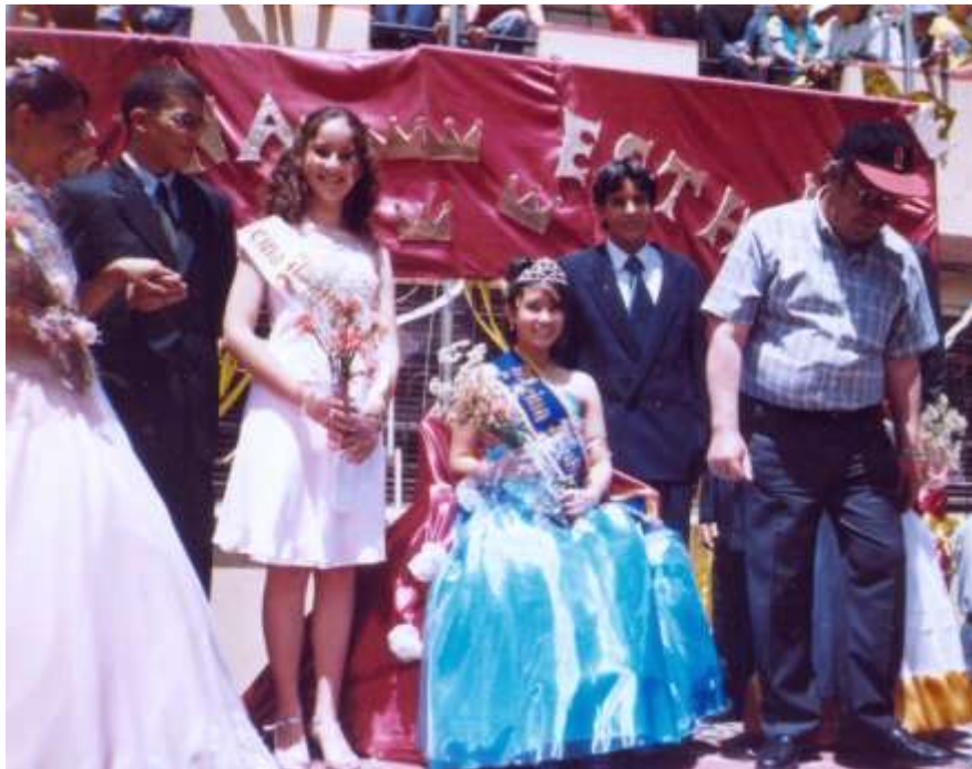
Celebración de Purim – Colegio Boliviano Israelita